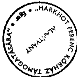
Csillik Pál az alapítvány képviselője